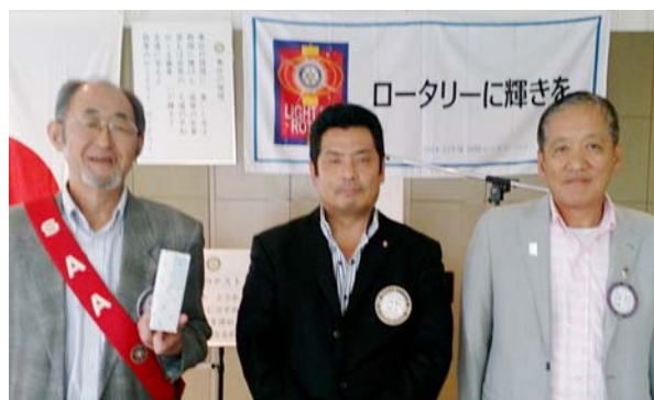
9月会員誕生の各会員