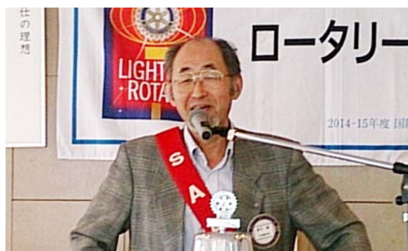
9月誕生 遠田会員スピーチ