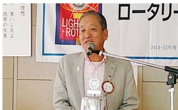
9月誕生 滝会員スピーチ